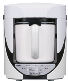
Cook Master Shunsai Pro White: YE-CM17B-WH オープン価格