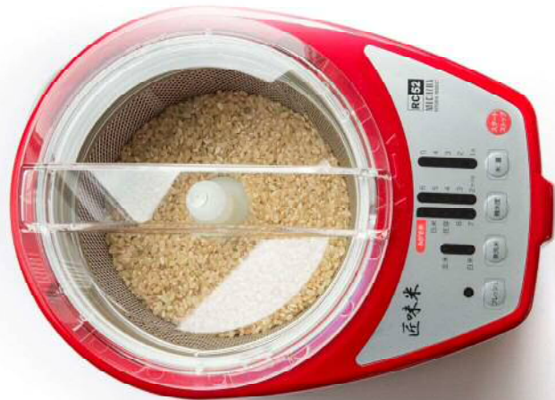
お米に合わせて 回転をデジタル制御

いつもの白米でも、玄米でも 新鮮 で美味しい状態のお米にする。 それが美味しさの条件です。